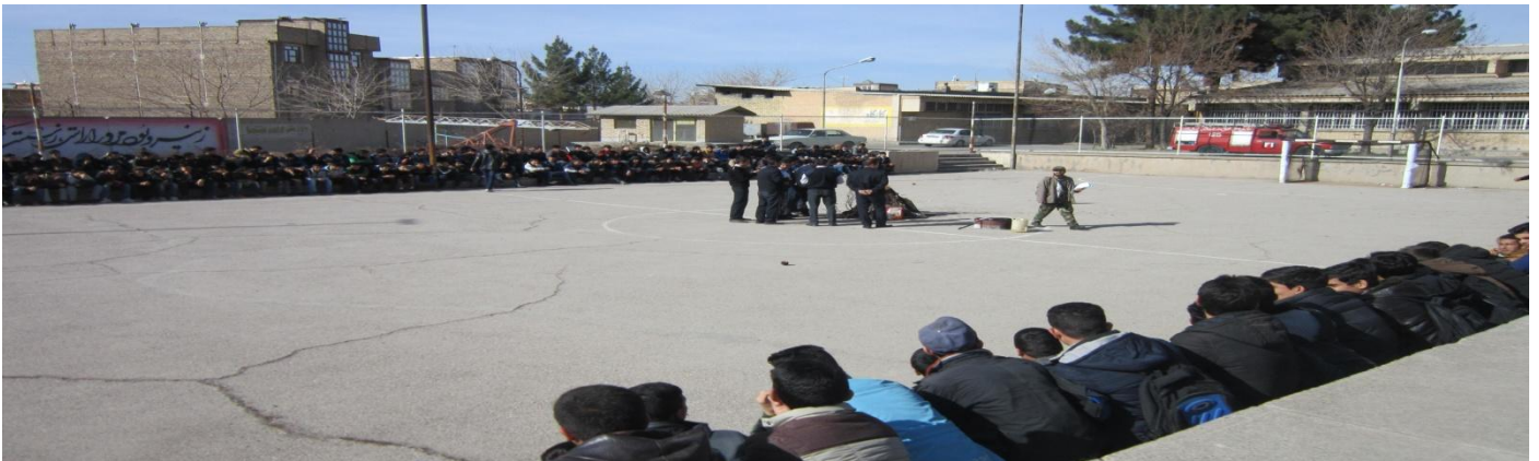
آموزش کارکنان شبکه بهداشت :