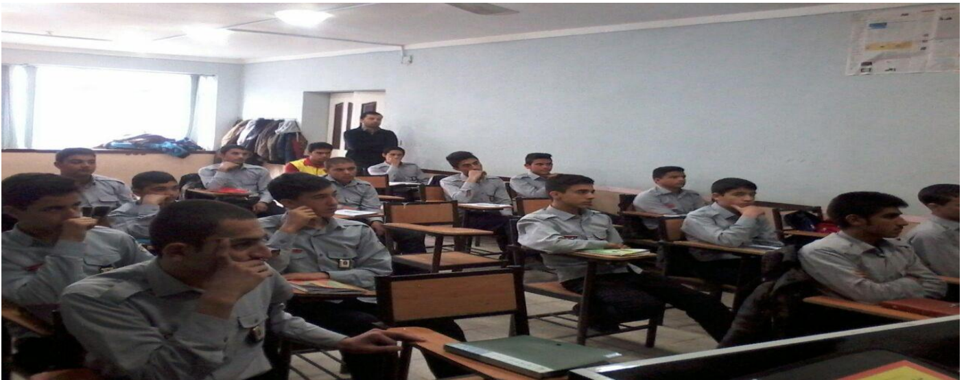
برگزاری امتحانات پایان ترم دانش آموزان آتش نشانی: