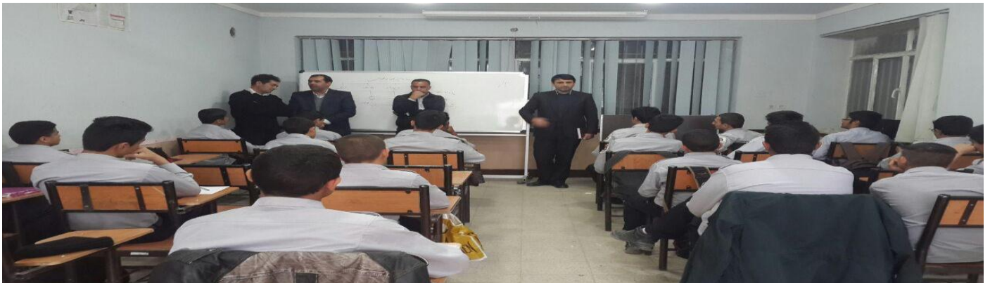
برگزاری تست عملیاتی دانش آموزان در حضور بازرسان و کارشناسان آموزش و پرورش: