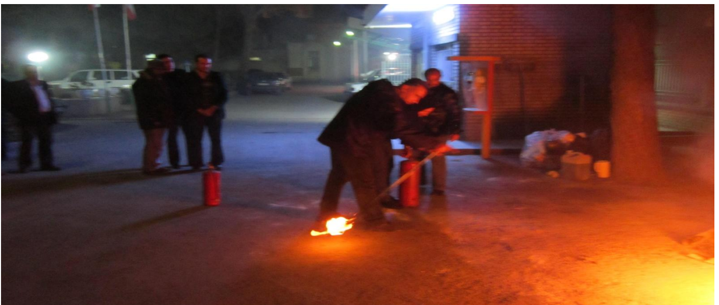
آموزش ضمن خدمت کارکنان مدرسان دانشگاه کشاورزی وفنی :